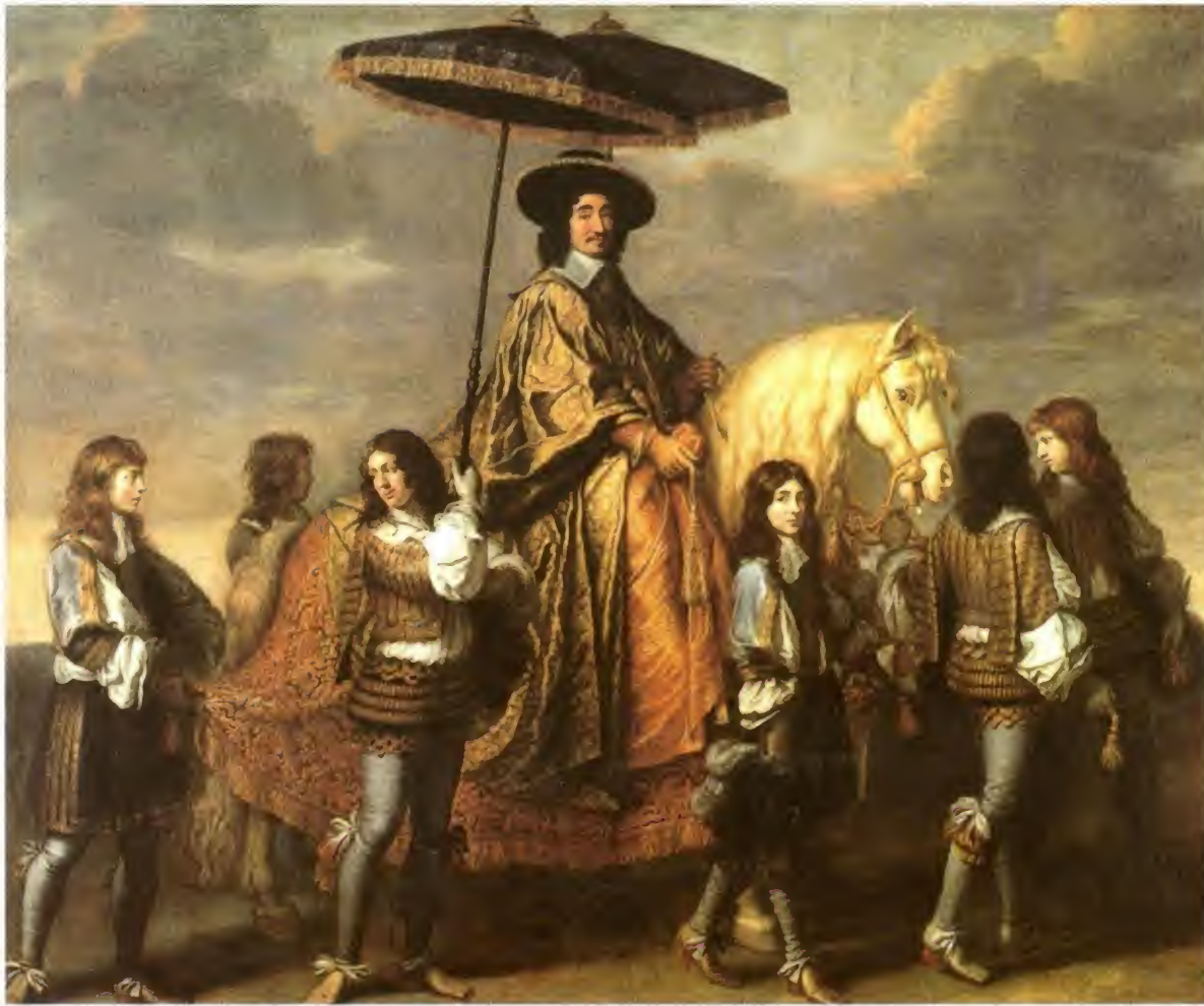
El canciller Séguier, uno de los grandes personajes del comienzo del reinado de Luis XIV (por Lebrun, Museo del Louvre)

Pero, sin duda, fueron los intendentes los grandes instrumentos del fortalecimiento de la autoridad monárquica. Creados en el siglo XVI para misiones ocasionales de inspección burocrática, recibieron un importante empuje con Richelieu y fueron definitivamente consolidados durante el reinado de Luis XIV. De ser un número reducido de funcionarios ocasionales pasaron a componer un cuerpo estable y cada día más numeroso —uno por provincia—. Sus amplísimos poderes debían hacer presente al rey en la provincia y, al tiempo, sofocar la posibilidad de actuación de los demás poderes locales. Tenían competencias de Justicia: debían vigilar a todos los oficiales de su competencia, podían presidir todos los tribunales y crear comisiones extraordinarias; de Policía: mantener el orden, solucionar los problemas de abastecimiento, atención de puentes y calzadas y vigilancia de los municipios;